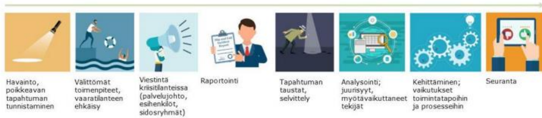
Kuva: Humana-konsernin määrittelemä poikkeamien käsittelyprosessi