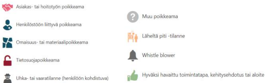
Kuva: Ilmoitettavat tapahtumatyytit

Nuorisokoti Nuotassa on käytössä Gurufield-poikkeamailmoitusjärjestelmä , jonne henkilöstö tekee asiakastyön ja henkilöstöön liittyvät poikkeamailmoitukset. Ilmoitus on mahdollista tehdä myös anonyymisti. Kannustamme työntekijöitämme raportoimaan matalalla kynnyksellä havaitsemistaan epäkohdista tai kehitysehdotuksista, jotta voimme parantaa toimintatapojamme entistä laadukkaammiksi. Gurufield-ilmoituksen voi myös tehdä anonyymisti.